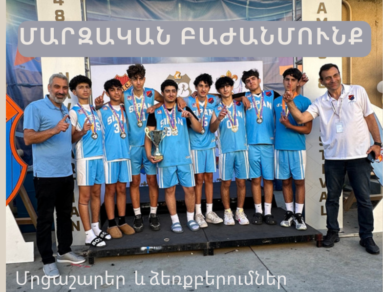
Մրցաշարեր և ձեռքբերումներ